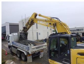
コンクリート殻積み込み状況