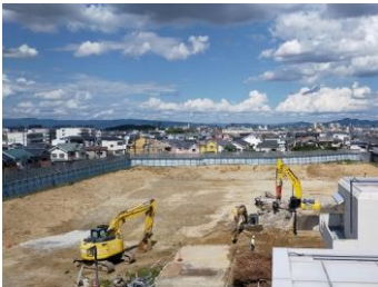
既設No.2、3配水池 解体作業状況