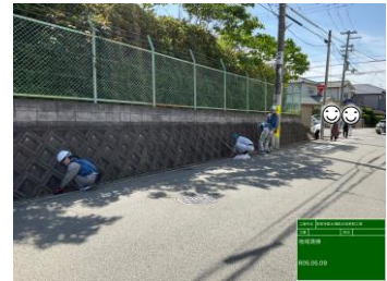
家原寺校区老人クラブ 松寿会様の清掃に参加