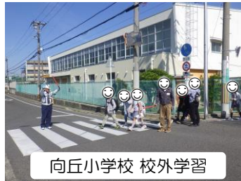
向丘小学校 校外学習