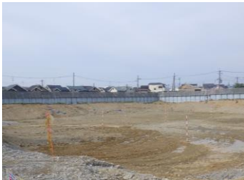
既設No.2、3配水池 既設構造物 撤去完了