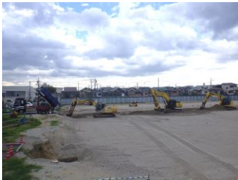
既設No.2、3配水池 土工 埋戻し作業状況