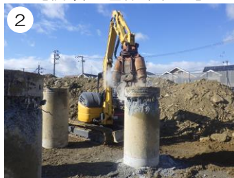
【杭頭処理事業状況】