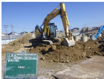
新設No.2配水池 基礎杭残土撤去状況