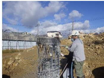
新設No.2配水池 杭頭処理状況