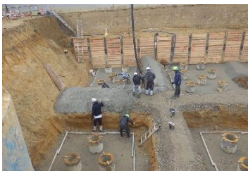
【基礎工 作業状況】※1月末時点