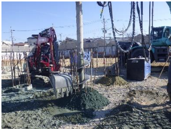
新設No.2配水池 杭頭処理状況