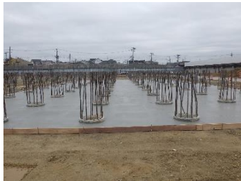
新設No.2配水池 均しコンクリート打設完了