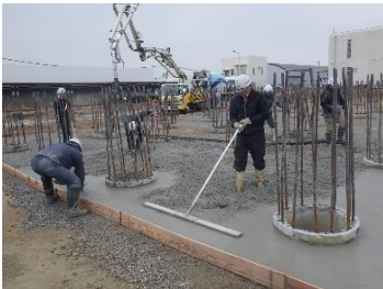
新設No.2配水池 コンクリート打設状況