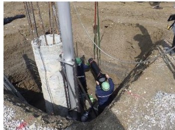
新設No.2配水池 配管状況