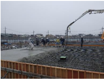
新設No.2配水池 コンクリート打設状況