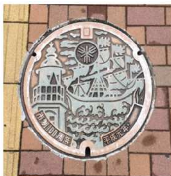
市制100周年（平成元年）を記念して、南蛮船及び日本最古の木造洋式灯台（商業の海運貿易の歴史の町・堺をイメージ）をデザインした蓋を作成しました。