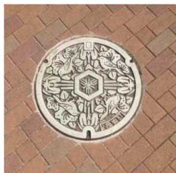
市制100周年（平成元年）を記念し市民の投票をもとに定められた、市の花木（ツツジ）・花（ハナショウブ）・鳥（モズ）をデザインした蓋を作成したものです。現在、堺市で一般に使用されている蓋です。