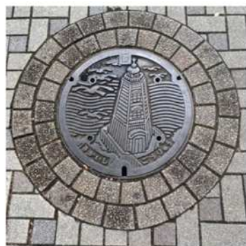
日本最古の木造洋式灯台（大浜北町5丁地先）をデザインした蓋を作成しました。

デザインマンホールは全国各地の自治体に設置され、デザインにはそれぞれの地域にゆかりのあるデザインや歴史が採用されています。堺市HPに、デザインマンホールの位置が掲載しておりますので、お近くにお出かけの際は、ぜひお立ち寄りください！