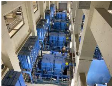
雨水ポンプ用減速機据付完了

さて、工事の進捗としては雨水ポンプの動力であるディーゼルエンジンもほぼ組みあがり、外装パッケージの組立を進めている段階です。 外装パッケージとは、万が一火災が発生してもパッケージ内に二酸化炭素を噴射して消火するための鋼板製の囲いのことで、エンジンを密閉する外装となります。 「そんな消火方法があるのかぁ」と思われる方もいらっしゃるかもしれませんが、水をかけられない精密機器などの設備向けの消火設備で、スーパーコンピューターの「富岳」がある理化学研究所にも同じ設備があるようです。 ひょっとしたら身近なところにも二酸化炭素消火設備があるかもしれませんね。