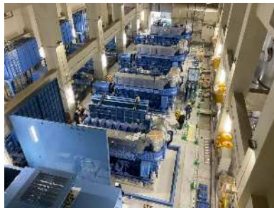
雨水ポンプ用原動機据付完了