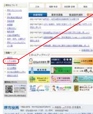
堺市ホームページ