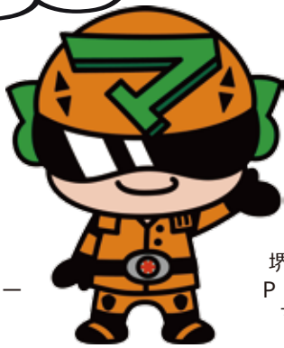
堺市上下水道局 PRキャラクター マモルンダー