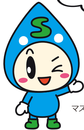
堺市上下水道局 マスコットキャラクター すいちゃん