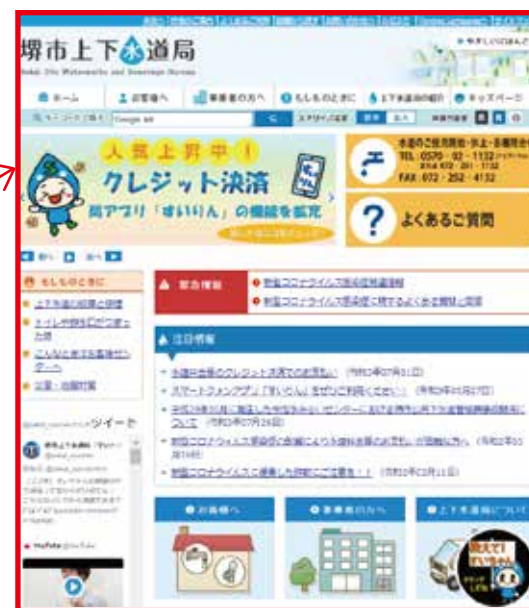
上下水道局ホームページ