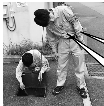
調査作業イメージ図