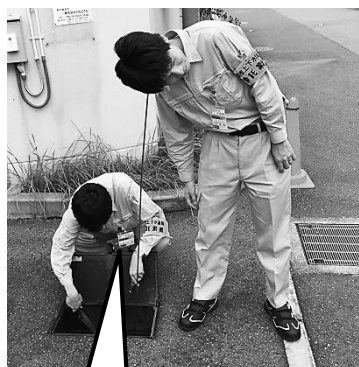
調査作業イメージ図

または、委託調査会社 株式会社生駒漏水 (平日 9:00 から 17:30 まで) ☎090-7268-8065