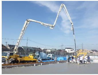
新設No.2配水池 コンクリート打設状況