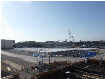
家原寺配水場 全体作業状況