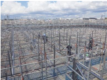
ステンスタック 組立状況