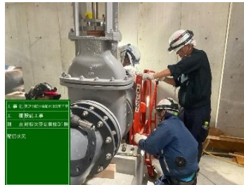
次亜塩素棟 施工状況（屋内配管）