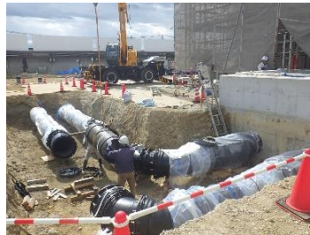
場内配管工事 施工状況