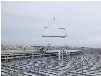
ステンスタック 組立状況