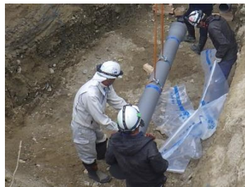
場内配管工事 施工状況