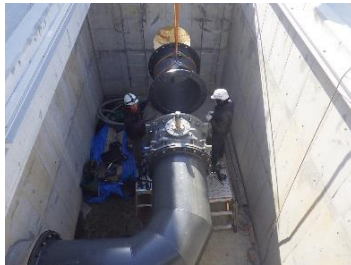
場内配管工事 施工状況