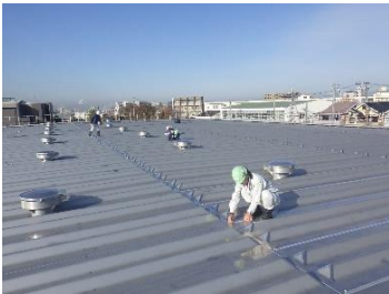
ステンスタンク 作業状況