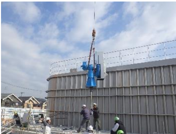
設備工事 機器据付状況