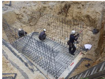
設備工事 地下燃料タンク 鉄筋組立状況